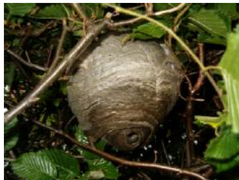
Wespen nest in de heg