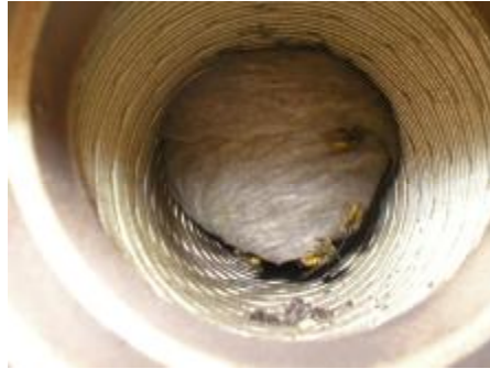
Ventilatie schacht van een afzuiginstallatie