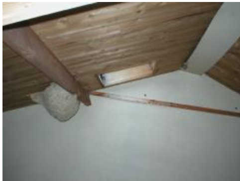
Wespen nest op zolder

Wespen leven in groepen bij elkaar in een wespennest. De werksters zijn onvruchtbare vrouwtjes; alleen de koningin legt eitjes. Wespen voeden zich met eiwithoudend en suikerhoudend voedsel. Om een nest te maken knagen ze aan hout, rietmatten enz. De mannetjes (darren) alleen in augustus/september, zij bevruchten de nieuwe jonge koninginnen. Alleen de jonge koninginnen overwinteren. Een wespennest wordt slechts 1 seizoen bewoond.